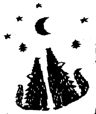
Рисунок 1 к задаче 3