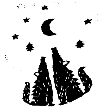
Рисунок 1 к задаче 3