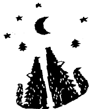
Рисунок 1 к задаче 3