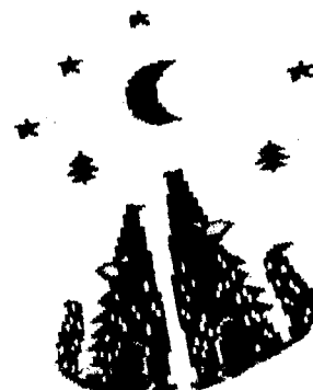
Рисунок 1 к задаче 3

3. Через какое время, относительно изображенного на рисунке дня, ожидать следующее новолуние?